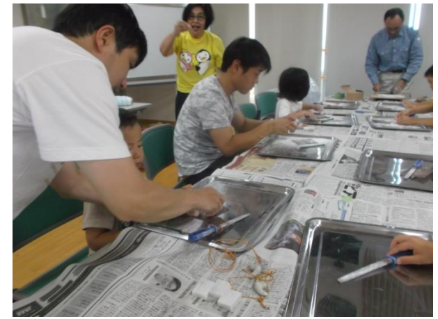
京都市埋蔵文化財研究所に よる『勾玉づくり』