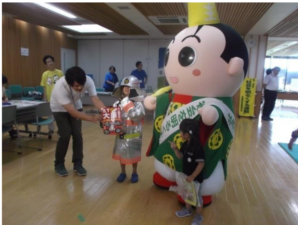
豆消防士さんとゆるキャラのツーショット 写真は缶バッジに