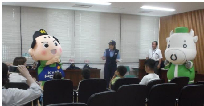
ゆるキャラも出演、上京警察署の『防犯教室』