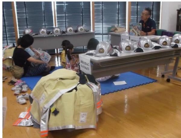
紙芝居を使った上京消防署の 『防災教室』