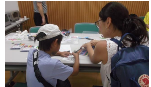
京都保護観察所のコーナーでは 親子で『防犯グッズづくり』