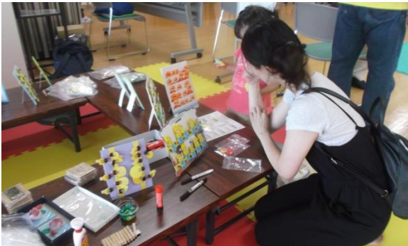
ミニヨンやアンパンマンが折り紙で