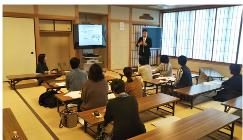
講演会の様子 笑いもあり、皆様の心もほぐれる講演会でした